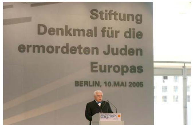
Architekt Peter Eisenman bei seiner Eröffnungsrede

Das Denkmal, das an die Ermordung von sechs Millionen Juden durch die Nazis erinnern soll, liegt südlich des Brandenburger Tors in unmittelbarer Nähe des Reichstags. Über 2700 unterschiedlich hohe Betonstelen wurden in den unregelmäßig abgesenkten Boden eingelassen. Dadurch ist ein Stelenfeld entstanden, das von allen Seiten begeh- und erfahrbar ist. Ergänzt wird es durch ein unterirdisches Informationszentrum, welches über das Schicksal der Opfer und die historischen Stätten des Holocaust aufklärt.