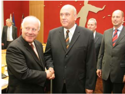
Besiegelten vor einem Jahr die Große Koalition in Sachsen: Georg Milbradt und Thomas Jurk