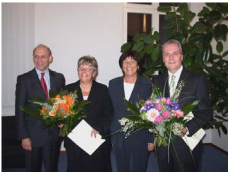
Bundesgesundheitsministerin Ulla Schmidt bei der Ernennung ihrer neuen Parlamentarischen Staatssekretäre Marion Caspers-Merk und Rolf Schwanitz

Am 23. November hat Bundesgesundheitsministerin Ulla Schmidt den vogtländischen Bundestagsabgeordneten Rolf Schwanitz zum Parlamentarischen Staatssekretär beim Bundesministerium für Gesundheit er-