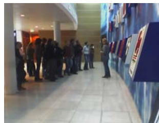
Im Willy-Brandt-Haus, Sitz des SPD-Parteivorstands

sprachen dennoch einige interessante Punkte abgewinnen. Höhepunkt des Programms war für die meisten natürlich der Besuch des Kanzleramts am Mittwoch. Der Besucherdienst erklärte u. a. Details zu Kanzlergalerie und