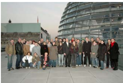
Vogtländische Besuchergruppe auf der Dachterrasse des Reichstags

Die Fußball-Weltmeisterschaft 2006 wird ein milliardenschweres Spektakel. In den zwölf deutschen Spielorten sind aber auch Tausende von Ehrenamtlichen aktiv. "Fans for Football" hilft Initiativen bei der Vorbereitung ihrer WM-Projekte. www.fansforfootball.org