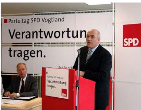
Thomas Jurk, SPD-Landesvorsitzender und Wirtschaftsminister Sachsens, forderte in Schöneck ein geändertes Privatschulgesetz

Standort der Berufsakademie. Rolf Schwanitz erwartet noch in diesem Jahr eine Verankerung des Standorts Plauen im Gesetz. Der Parlamentarische Staatssekretär im Bundesgesundheitsministerium äußerte sich kritisch zur Kreisreform und deren Fahrplan in Sachsen. Bei der Föderalismusreform in Deutschland sieht er noch erheblichen Veränderungsbedarf. "In dieser Form darf dies nicht ins Grundgesetz", so Schwanitz zu den Delegierten. Thomas Jurk, der stellvertretende Ministerpräsident und Wirtschaftsminister Sachsens, sprach sich in Schöneck für ein geändertes Privatschulgesetz aus. Hier liegen in der sächsischen Koalition die Positionen noch weit auseinander. Private Schulen dürfen kein Privileg der Besserverdienenden sein. Für die SPD ist der Zugang von Kindern aus sozial schwächeren Familien entscheidend. Der Parteitag ist mit seinen Beschlüssen und Diskussionen dem Motto "Verantwortung tragen" voll gerecht geworden.