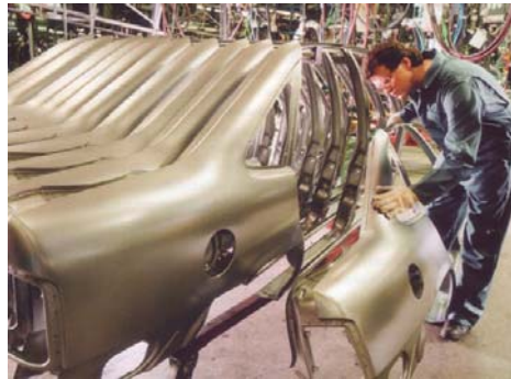
Ziel: Verbesserte Rahmenbedingungen für mehr Wachstum und Beschäftigung

Mit dem heute vom Deutschen Bundestag verabschiedeten Gesetzentwurf zur steuerlichen Förderung von Wachstum und Beschäftigung setzt die große Koalition einen weiteren Teil des verabredeten Wachstumspakets um. Folgende Maßnahmen sind u. a. geplant: