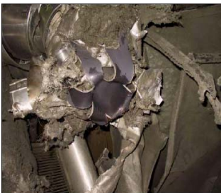
AKW Brunsbüttel: Explodierte Rohrleitung nahe des Reaktordruckbehälters

Vor knapp 20 Jahren - am 26. April 1986 - kam es im Block 4 des sowjetischen Atomkraftwerks Tschernobyl zu einer unkontrollierten Kernschmelze, die zur Zerstörung des Reaktorblocks 4 und zur weiträumigen Freisetzung von Radioaktivität führte. Besonders betroffen waren Gebiete in Belarusland, Russland und der Ukraine. Eine radioaktive Wolke verteilte die Substanzen aber auch über weite Teile Westeuropas. Insgesamt wurden in ganz Europa Flächen von mehr als 200.000 Quadratkilometer kontaminiert. Auch weite Teile Süd- und Ostdeutschlands waren betroffen. Über 100.000 Menschen wurden unmittelbar nach der Katastrophe aus einer 30-km-Zone rund um den Unglücksreaktor evakuiert. In den folgenden