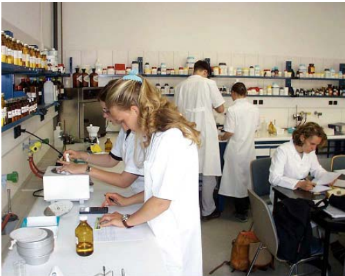
Pharmazeutisch-technische Assistenten bei der Arbeit im Labor des IWB Plauen

Das Institut für Wissen und Bildung (IWB) in Plauen ist eine Ausbildungsstätte für technische Assistenten im medizinischen und pharmazeutischen Bereich. Das IWB bietet seit 1997 eine private berufliche Ausbildung an, welche vom Land Sachsen gefördert wird. Damit steht es im Wettbewerb um Auszubildende in staatlichen Berufsschulen. Die Schülerzahlen sind in Sachsen seit 1992 von 738.000 auf