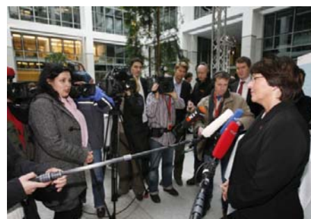
Journalisten-Gespräche: Bundesministerin Ulla Schmidt auf dem Reformtag im Bundesgesundheitsministerium

"Innovationspotenziale im deutschen Gesundheitswesen" war das Thema eines Reformtages, zu dem Bundesministerin Ulla Schmidt am 1. Dezember Gesundheitsfachleute aus verschiedenen Disziplinen und aus der Praxis geladen hatte. Mit rund 250 Gästen und den Fachleuten auf dem Podium diskutierte die Ministerin die Zukunftsthemen der gesundheitlichen Versorgung und erörterte die Frage, inwiefern gesundheitspolitische Weichenstellungen Innovationen fördern können, die den Patientinnen und Patienten direkt zugute kommen. In ihrem Eingangsstatement wandte sich Ulla Schmidt gegen alle, die jede Art der Veränderung ablehnen, um ihren Status quo zu halten: "Ich möchte Sie alle ermuntern, die Dynamik der Gesundheitsbranche und deren Beherrschung als Herausforderung zu begreifen und als Chance für diejenigen, um die es eigentlich geht: die Patientinnen und Patienten."