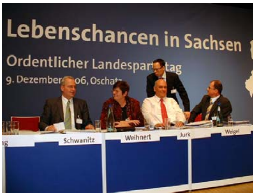
Präsidium des SPD-Landesparteitages