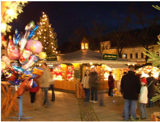
Weihnachtsmarkt in Auerbach

Was wäre die Adventszeit ohne die beliebten Weihnachtsmärkte! Hier kann man bei Glühwein und Lebkuchen, gebrannten Mandeln und Schokoäpfeln so manche Stunde verbringen und sich mit Musik und liebevoller Dekoration in vorweihnachtliche Stimmung versetzen lassen. Doch ein Weihnachtsmarkt eignet sich nicht nur zum Schlem-