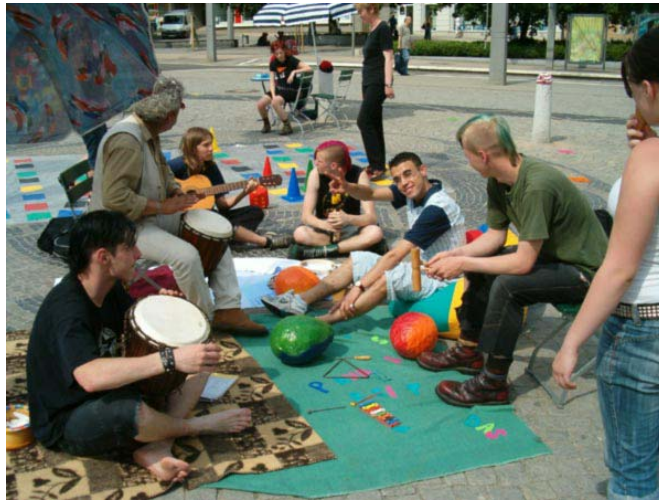
Mobile Jugendarbeit in Plauen