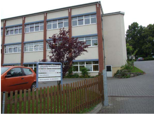
Das Gebäude der Lebenshilfe in Reichenbach