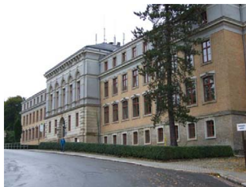
Profitierte vom Ganztagschulprogramm des Bundes: Die Seminarschule in Auerbach

Unterstützt wird das Ganztagschulprogramm des Bundes in Sachsen durch das von der CDU-SPD-Koalition in Dresden aufgelegte Begleitprogramm. Hierbei werden die Investitionen sinnvoll durch finanzielle Hilfen für Honorarkräfte an den Schulen ergänzt. Besonders wichtig: Von den insgesamt hierfür im Freistaat vorgesehenen 30 Millionen Euro sind nach derzeitigen Prognosen (bisher erfolgte Bewilligungen und noch zu bescheidende Anträge) in diesem Jahr erst 16 Millionen Euro abgeflossen. Fast die Hälfte der Fördermittel steht also noch zur Verfügung. "Eine solche Chance sollten sich die Schulen im Vogtland nicht entgehen lassen. Ich fordere alle interessierten Schulen auf, jetzt noch Anträge zu stellen.", so Schwanitz zu der Situation.