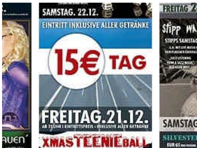
Auszug aus der Homepage des "N.1"

ächtet und werden durch die Kommunen verboten. Denn nach geltendem Recht sind Veranstaltungen mit "Flatrate-Angeboten" für alkoholische Getränke unzulässig, die erkennbar auf die Verabreichung von Alkohol an Betrunkene abzielen. Bereits im Vorfeld kann die Bewerbung entsprechender Veranstaltungen verboten werden, da die Annoncierung solcher Veranstaltungen ein klares Indiz für die Abgabe von Alkohol an Betrunkene darstellt. Und die Durchführung solcher Veranstaltungen kann zum Widerruf der Gaststättenerlaubnis führen. Andernorts hat man dies gelernt und reagiert entsprechend. Anders jedoch bisher in Plauen. Obwohl Rolf Schwanitz die Verantwortlichen im Rathaus zum Handeln aufgefordert hat, schauen diese offenbar weiter weg.