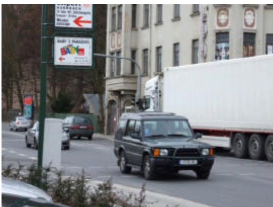
Noch führt die B 169 durch Auerbach

des BMVBS kann das Planfeststellungsverfahren für die Ortsumgehung weiter vorangetrieben werden. Und auch die vogtländischen Kommunen im Göltzschtal bekommen jetzt größere Planungssicherheit für ihre eigenen Straßenbaumaßnahmen." Die Ortsumgehung Göltzschtal ist das wichtigste Infrastrukturvorhaben des Bundes im Vogtland. Schwanitz hatte sich bereits dafür stark gemacht, dass die Maßnahme im "Vordringlichen Bedarf" des Bundesverkehrswegeplans eingestellt und auch im Investitionsrahmenplan des Bundes bis 2010 berücksichtigt wurde. Mit dem Prüfungsvermerk ist nun eine weitere Etappe für die Ortsumgehung im Göltzschtal erreicht.