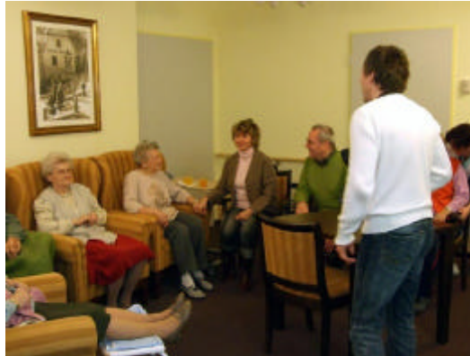
Rolf Schwanitz überzeugte sich vor Ort vom besonderen Charakter der "Seniorenresidenz"

sprünglich als Manufaktur gebaut wurde. Drei Millionen Euro investierte der Bauherr in den Umbau. Die Gesellschaft ändert sich. Altersdurchschnitt und Lebenserwartung steigen. Darauf muss auch die Politik reagieren. Ambulante und stationäre Pflege müssen besonders gefördert werden, so Rolf Schwanitz. Das Einführen der Pflegeversicherung 1995 war für ihn ein erster wichtiger Schritt. Ein weiterer ist die geplante Anhebung der Pflegesätze im Laufe dieses Jahres. Ab 2009 soll zudem die Bera-