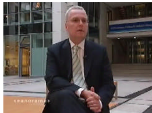
Rolf Schwanitz während des Interviews

Um gefährliche Krankenhauskeime, wie die weitgehend resistenten MRSA-Bakterien (Methicillin-resistenter Staphylococcus aureus), besser bekämpfen zu können, beabsichtigt die Bundesregierung, das Infektionsschutzgesetz zu ändern. Dies sagte der Staatssekretär im Bundesministerium für Gesundheit, Rolf Schwanitz, dem NDR-Politikmagazin "Panorama". Zukünftig sollen Risikopatienten bereits bei der Aufnahme ins Krankenhaus auf MRSA untersucht werden. Außerdem soll eine Meldepflicht eingeführt werden, nach der Krankenhäuser jeden MRSA-Fall den zuständigen Gesundheitsämtern anzeigen müssen. Bisher besteht eine Meldepflicht nur, wenn eine "Häufung" von MRSA-Keimen auftritt. Das Bundesministerium für Gesundheit wird nach Aussage des Staatssekretärs Gespräche mit den Ländern über eine entsprechende Novellierung des Infektionsschutzgesetzes führen.