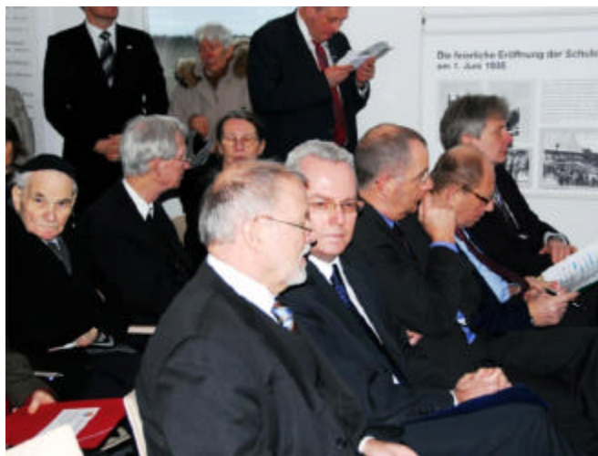
Mecklenburg-Vorpommerns Ministerpräsident Harald Ringstorff und der Parlamentarische Staatssekretär Rolf Schwanitz bei der Gedenkveranstaltung in Alt-Rehse

medizin- oder bioethischen Problemen der Gegenwart widmen können. Alt-Rehse ist gerade wegen seiner Vergangenheit ein geeigneter Ort für solche Diskussionen. "Ich wünsche mir," so Rolf Schwanitz, "dass Alt-Rehse zukünftig nicht mehr primär mit der Vergangenheit, sondern mit moderner Medizin-Ethik assoziiert wird."