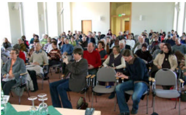
Mit Interesse verfolgten die Teilnehmer der Veranstaltung die Diskussion über Patientenverfügungen