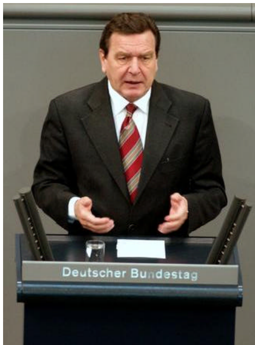
Gerhard Schröder stellte am 14.3.2003 seine Agenda 2010 im Deutschen Bundestag vor

Viele dieser Entwicklungen gehen zumindest mittelbar auf noch in der vorangehenden Legislaturperiode