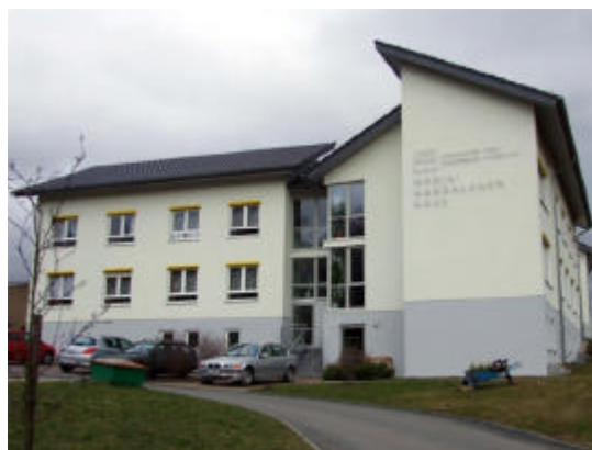
Das Altenpflegeheim "Maria Magdalena"

Geborgenheit unter dem Dach der sozialen Pflegeversicherung. Damit setze die Diakonie Maßstäbe in der Pflege. Während sich die Gäste anschließend noch zu einem kleinen Stehbuffet zusammenfanden, ließen die Seniorinnen und Senioren die Feier bei Kaffee und Kuchen ausklingen.