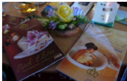
Auch die vogtländischen Staatsbäder präsentierten sich professionell auf der ITB 2008