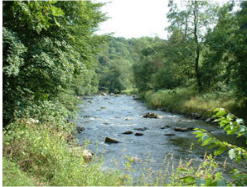
Die Weiße Elster im Vogtland