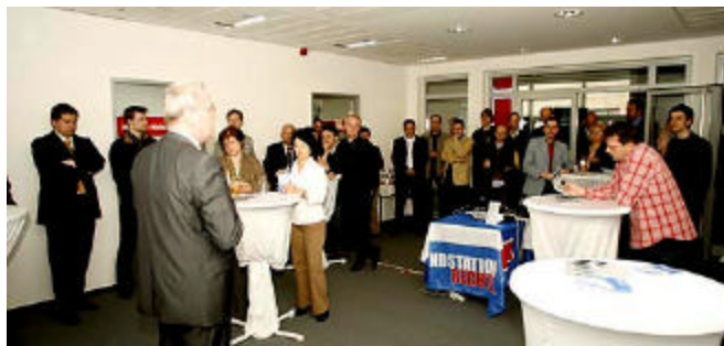
Endstation Rechts wird in Dresden vorgestellt

sowie Projekttag anbieten und sich an Demonstrationen gegen Rechts beteiligen. Noch steht die Initiative am Anfang. Aber es finden immer mehr Berichte und Informationen den Weg zu www.endstation-rechts-sachsen.de . Wer selbst aktiv werden möchte, muss nicht warten. Einfach das Kontaktformular ausfüllen und dabei sein.