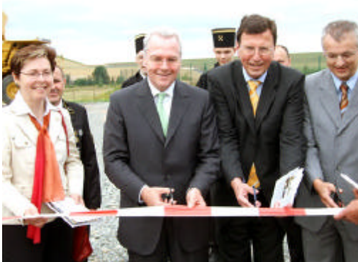
Der neue Technik-Park wird eröffnet

Am 28. Juni 2008 eröffnete der Bergbauverein Ronneburg den zweiten Teil seines Technik-Parks am ehe-