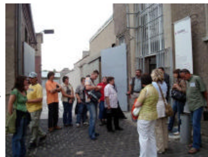
Im Stasigefängnis Hohenschönhausen