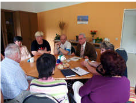
Rolf Schwanitz im Gespräch mit Mitarbeitern der Teestube Adorf

Im Gespräch mit Rolf Schwanitz war man sich schnell einig: Vorbeugen ist besser als heilen. Ein Präventionsgesetz könnte dabei helfen, liegt aber momentan in Berlin auf Eis, weil die Union den Gesetzentwurf blockiert. Doch Rolf Schwanitz wurde auch mit konkreten Fragen konfrontiert. Viele der ehrenamtlichen Helfer der Teestube haben selbst ein geringes Einkommen oder sind arbeitslos. Warum sollen diejenigen, die helfen, nicht selbst einen Anspruch auf Hilfe bei der Arbeitssuche haben? Kann die Teestube über ein Modellprojekt des Bundes gefördert werden? Einige Vorschläge wird der Abgeordnete in Berlin prüfen. Im Mai 2009 will er die Teestube in Adorf erneut besuchen.