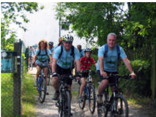
Unterwegs in Syrau

Die Zahl der Insolvenzverfahren in Sachsen ist zurückgegangen. Im 1. Halbjahr 2008 gab es insgesamt noch 4236 Insolvenzverfahren; 910 Unternehmensinsolvenzen und 3326 Privatinsolvenzen. Gegenüber dem 1. Halbjahr 2007 war das ein Rückgang von 14,8 Prozent. Der Rückgang betraf sowohl die Unternehmen (-4,9 Prozent) als auch die privaten Personen und Nachlässe (-17,1 Prozent). Bei den Verbraucherinsolvenzverfahren betrug der Rückgang sogar 19,3 Prozent. Obwohl die Zahl der Insolvenzverfahren insgesamt zurückging, nahm der Umfang der angemeldeten Forderungen um fast 7 Prozent zu, außer im Direktionsbezirk Chemnitz, wo ein Rückgang von fast 10 Prozent zu verzeichnen war.