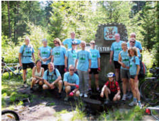
An der Elsterquelle

Am 26. und 27. Juli unternahm der Bundestagsabgeordnete Rolf Schwanitz (SPD) seine mittlerweile zehnte Sommer-Radtour quer durchs Vogtland. Wieder galt es, Werbung für das Vogtland als eine Radtourismusregion mit Zukunft zu machen und vogtländische Radwege zu testen. Während sich der erste Tag der Suche nach dem besten Einstieg von deutscher Seite in den Elster-Radweg mit Start in Bad Brambach und Ziel in Adorf widmete, radelten Rolf Schwanitz und seine Begleiter am zweiten Tag von Plauen bis nach Elsterberg und verknüpften dabei Radtourismus und Kultur. Besuche im Spitzenmuseum, der Kirche in Kauschwitz, der Syrauer Windmühle und der Burgruine Elsterberg standen auf dem Programm. Am Ende hatten die Teilnehmer mit einer Gesamtstrecke von 90 Kilometern eine der schönsten Sommer-Radtouren erlebt. Gerade für die auswärtigen Gäste stand fest: "Wir sind 2009 erneut mit dabei!" Beim Elster-Radweg ist die Quelle als "Eingangstor" für den überregionalen Fernradweg bei der touristischen Vermarktung natürlich von besonderer Bedeutung. Bei der Radtour wurde klar, dass die Variante über Bad Brambach, Hohendorf, Bärenndorf bis zur Elster-Quelle der optimale