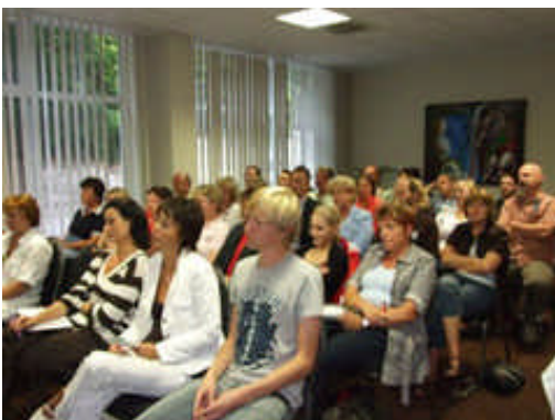
Teilnehmer der FES-Veranstaltung in Plauen