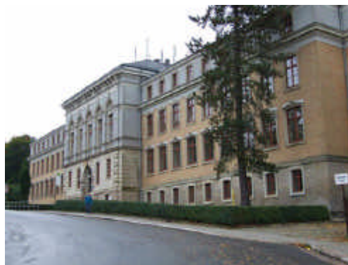
Schulen und Straßen: Neues mittelstandsfreundliches Vergaberecht bei der Sanierung

von abhängt, ob ein Unternehmen sich an für allgemeinverbindlich erklärte Tarifverträge hält." Das Gesetz sieht auch vor, dass zusätzliche Anforderungen - insbesondere an soziale, umweltbezogene und innovative Aspekte - gestellt werden dürfen, wenn sie im sachlichen Zusammenhang mit der einzukaufenden Leistung stehen.