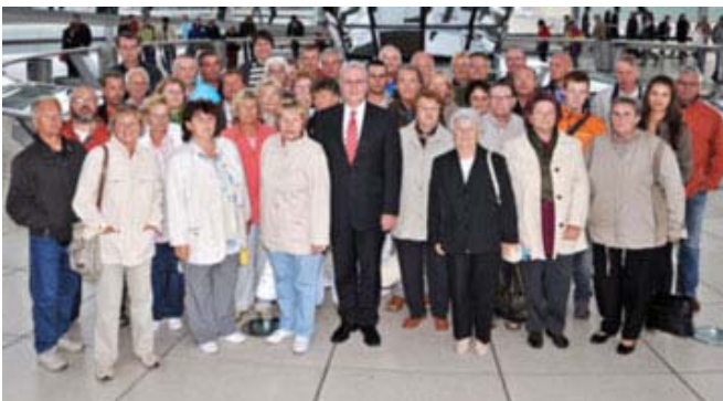
Die Besuchergruppe aus dem Vogtland gemeinsam mit Rolf Schwanitz unter der Kuppel des Reichstags

Reichstagsgebäude wurde am Nachmittag der Plenarsaal des Deutschen Bundestages besichtigt, und ein Vortrag stellte die Aufgaben und die Arbeit des Parlaments dar. In einer angeregten Diskussion stand danach Rolf Schwanitz Rede und Antwort. Der abschließende Besuch der Glaskuppel und Dachterrasse fiel wegen Regenwetters leider sprichwörtlich ins Wasser. Der letzte Vormittag wurde zu einem Besuch im Jüdischen Museum genutzt. Hier gab es viel Wissen und interessante Details über die jahrhundertelange Geschichte der jüdischen Gemeinde in Deutschland zu erfahren. Als sich die Gruppe dann wieder auf den Heimweg ins Vogtland machte, fiel das Fazit der Teilnehmer durchweg positiv aus. Berlin ist immer wieder eine Reise wert.