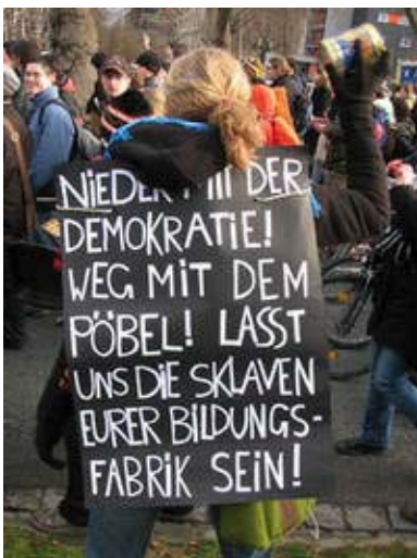
Studentenproteste in Dresden

das auch auf eine Bachelorausbildung für Abiturienten zielt. Ein konkurrierendes Bildungsangebot zur Berufsakademie ist also trotz gegenteiliger Beteuerungen vorprogrammiert. In einer nachgereichten Ergänzung wurden darüber hinaus sogar noch Andeutungen über eine duale Ausbildungsform an der Privat-Uni gemacht. Das würde die Konkurrenz zur Berufsakademie zusätzlich verschärfen. Der nun gefasste Beschluss ist vor allem in Richtung Dresden ein falsches Signal, das sich nach der Landtagswahl noch bitter rächen kann. Er ist eine Steilvorlage für eine neue unter ganz anderem finanziellen Druck stehende Staatsregierung, die nun ein bequemes Argument in den Händen hat, das Projekt "Campus Amtsberg" oder sogar den Ausbau der Berufsakademie selbst in Frage zu stellen.