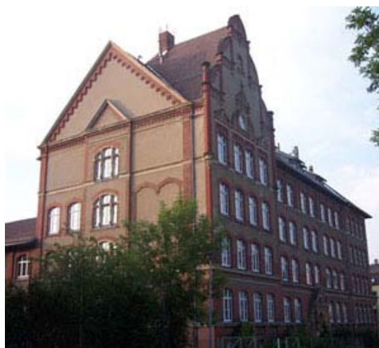
Kemmler-Mittelschule in Plauen wird nun doch saniert

macht, schaltete er nicht nur die SPD-Minister in der sächsischen Staatsregierung, sondern auch das Bundesfinanzministerium ein. Inzwischen musste Wölller zurückrudern und hat die Rücknahme des Förderbescheids angekündigt.