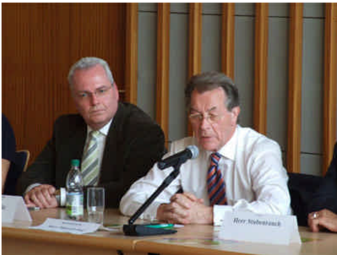
Franz Müntefering und Rolf Schwanitz im Plauener Rathaus

Der Bundesvorsitzende der SPD, Franz Müntefering, besuchte am 15. August auf Einladung von Rolf Schwanitz die Stadt Plauen. Nach dem Besuch der "Bürgerstube Stubenrauch" ging es über den Plauener Altmarkt zur Besichtigung eines Plauener Markenzeichens - des Spitzenmuseums. Anschließend nahm er im Kleinen Ratssaal im