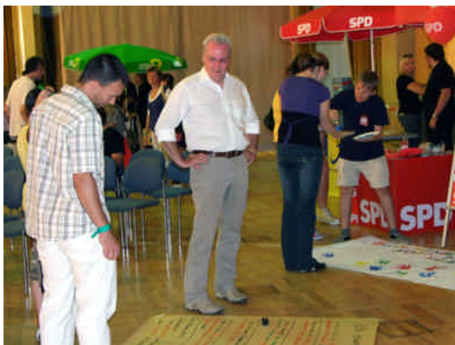
Bodenzeitung der Jusos beim Wählerforum in Oelsnitz

sche Forderung "Kita frei ab drei!" stieß auf breite Zustimmung im Publikum. Einhellige Meinung aller Beteiligten war, dass eine solche Veranstaltung in jedem Fall vor den nächsten Wahlen wiederholt werden soll.