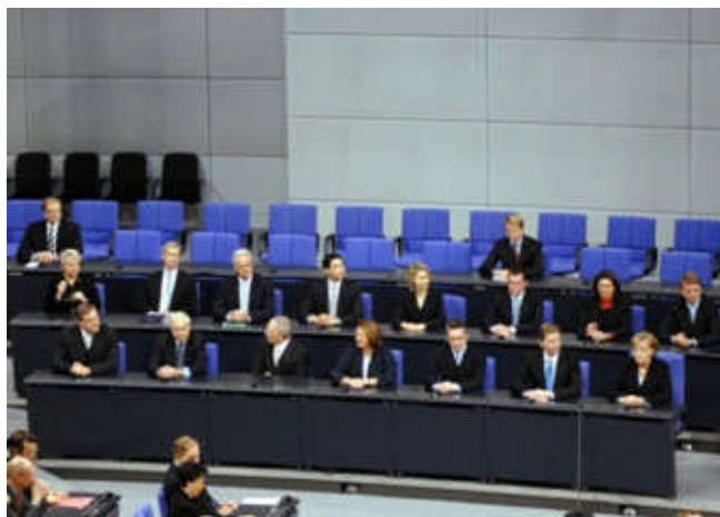
Ostdeutsche sind in der neuen schwarz-gelben Bundesregierung unterrepräsentiert

ändert daran nach Auffassung von Rolf Schwanitz nichts. "Konsequenterweise hätte Merkel dann den Aufbau Ost zur Chefsache machen und ihn direkt ins Kanzleramt zurückholen müssen. Ich fordere sie dazu ausdrücklich