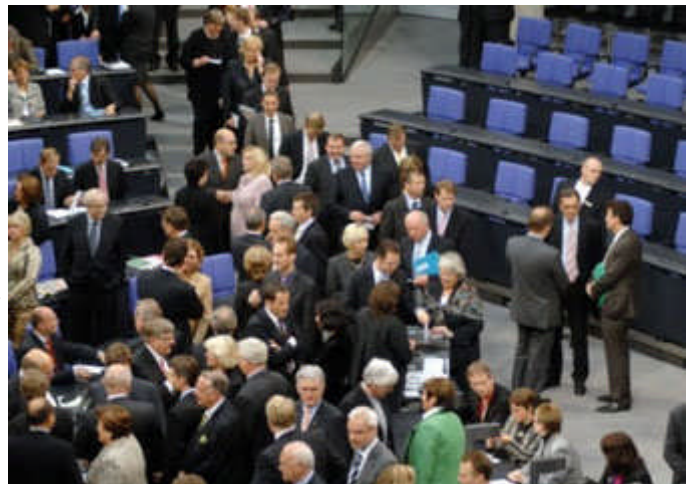
Die neugewählten Bundestagsabgeordneten stimmen ab