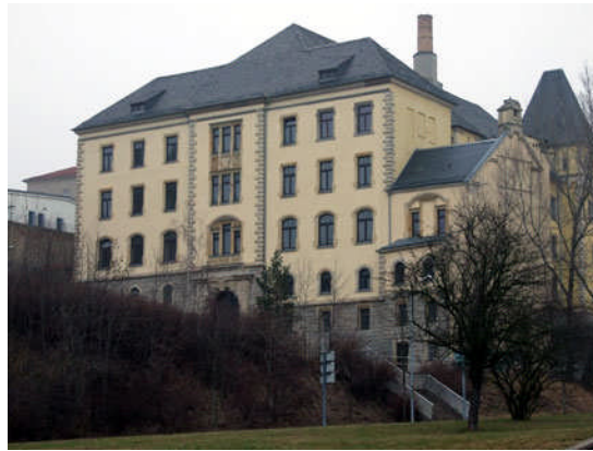
Campus Amtsberg: Die Plauener Studienakademie soll hier heimisch werden

mie Plauen ein. Dank der Unterstützung der früheren Wissenschaftsministerinnen Ludwig und Stange (beide SPD) sind wir dabei bisher gut vorangekommen. Wenn nun der kürzlich der CDU beigetretene Finanzminister bei seinen Sparüberlegungen als erstes an Plauen denkt, sieht er die regionalpolitischen Notwendigkeiten offensichtlich nicht."