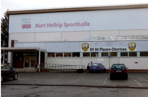
Auch die Plauener Kurt-Helbig-Sporthalle profitierte vom Goldenen Plan Ost