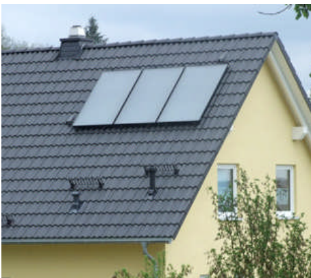
Schwarz-gelb streicht Investitionszuschüsse für Solarkollektoren

darauf ausgerichtet. Viele werden sauer sein, dass diese Zusagen nun nicht mehr gelten." Nach Aussage des BMU hat die Mittelsterrung auch Auswirkungen auf die Programme der Nationalen Klimaschutzinitiative. Das Förderprogramm für kleine Anlagen der Kraft-Wärme-Kopplung (Mini-KWK) und das Programm zur Förderung von Klimaschutzprojekten in Kommunen müssen sogar rückwirkend gestoppt werden, da schon mit den bereits bewilligten Anträgen das Budget für 2010 voll ausgeschöpft wird. Rückwirkend heißt, dass Anträge, die aus dem vergangenen Jahr vorliegen und noch nicht bewilligt worden sind, nicht mehr genehmigt werden. Fazit: Schwarzgelb lässt die Förderprogramme für erneuerbare Energien ausbluten und gefährdet bundesweit hunderttausende Jobs.