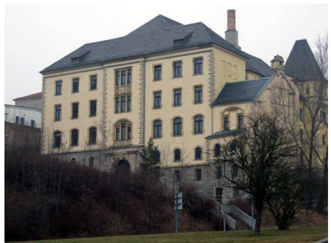
Campus Amtsberg: Die Plauener Studienakademie soll hier heimisch werden

Die schwarz-gelbe Regierungskoalition hat drastische Kürzungen bei der Solarstromvergütung beschlossen. Dies zerstört nach Auffassung des vogtländischen SPD-Bundestagsabgeordneten Rolf Schwanitz nicht nur das Vertrauen bei Investoren, Handwerkern und Herstellern, sondern setzt auch die Vorreiterrolle der deutschen Solarbranche aufs Spiel. Deutschland droht somit im weltweiten Technologieren den Anschluss zu verlieren. "Die zusätzliche Einmalabsenkung der Vergütung von Solarstrom zwischen 11 und 16 Prozent sowie die verschärfte Degression zum Jahresbeginn werden große Teile der Solarindustrie vor unlösbare Herausforderungen stellen. Zehntausende Arbeitsplätze sind in Gefahr.", sagte Schwanitz. Völlig unverständlich und inakzeptabel ist für ihn auch der Ausschluss von Ackerflächen aus der EEG-Vergütung. "Es sollte Aufgabe der Kommunen sein, mit Blick auf die jeweiligen regionalen Strukturen über die Nutzung von Ackerflächen zu entscheiden.", so Schwanitz.