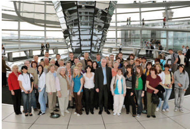
Gruppenfoto mit Rolf Schwanitz unter der Kuppel des Reichstagsgebäudes