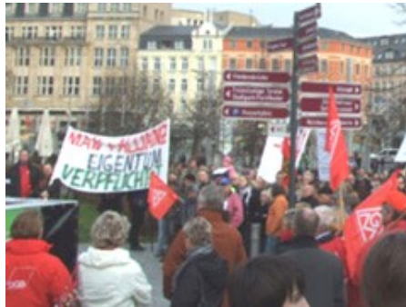
Demonstration der manroland-Mitarbeiter am 1.12.2011 in Plauen