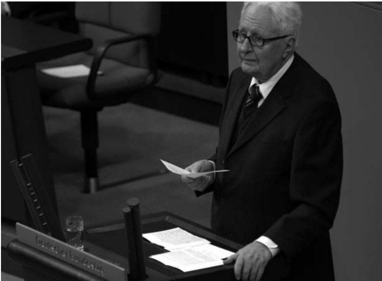
Dr. Hans-Jochen Vogel

Dr. Hans-Jochen Vogel in der Gedenkstunde „Die Zerstörung der Demokratie in Deutschland vor 75 Jahren“ des Deutschen Bundestages am 10. April 2008.