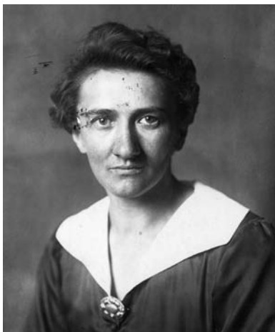
Toni Pfülf um 1920

In ihrer Biografie der sozialdemokratischen Reichstagsabgeordneten Antonie Pfülf 1 schildert Antja Dertinger 2 die Ereignisse des 23. März von der Sitzung der SPD-Reichstagsfraktion im Reichstag bis zur Abstimmung über das „Ermächtigungsgesetz“ in der Kroll-Oper.